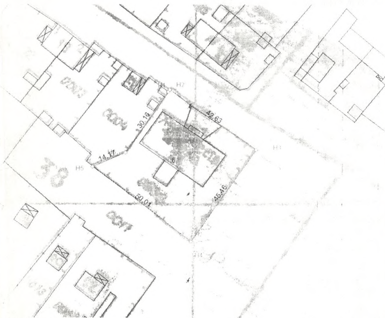
Схема геодезических измерений